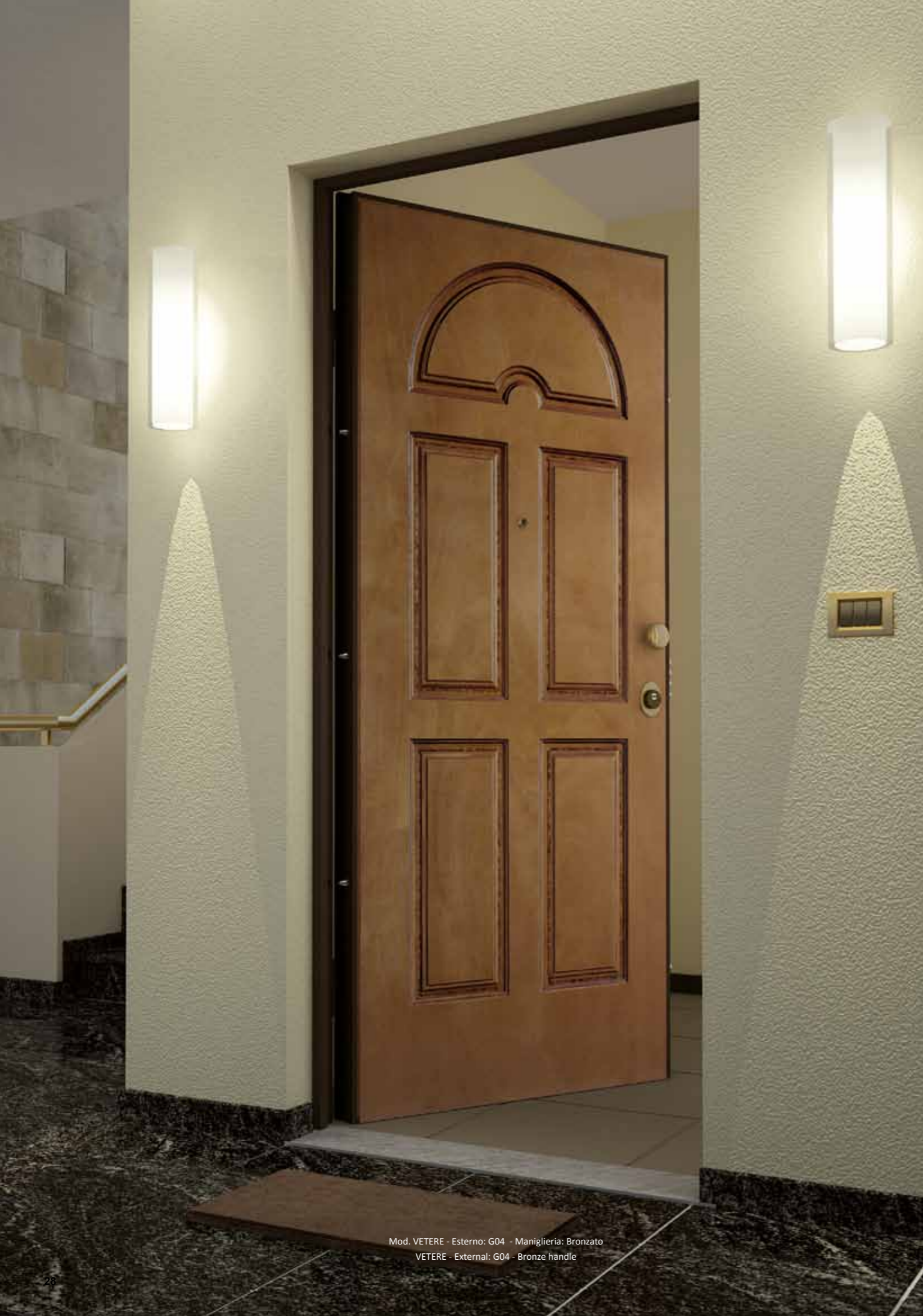
Mod. VETERE - Esterno: G04 - Maniglia: Bronzato VETERE - External: G04 - Bronze handle