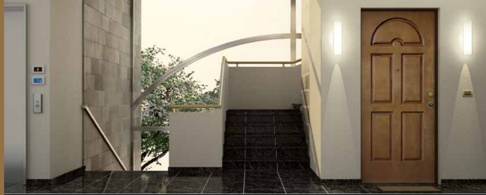
Porta blindata - Resistenza all'effrazione "Classe 3"