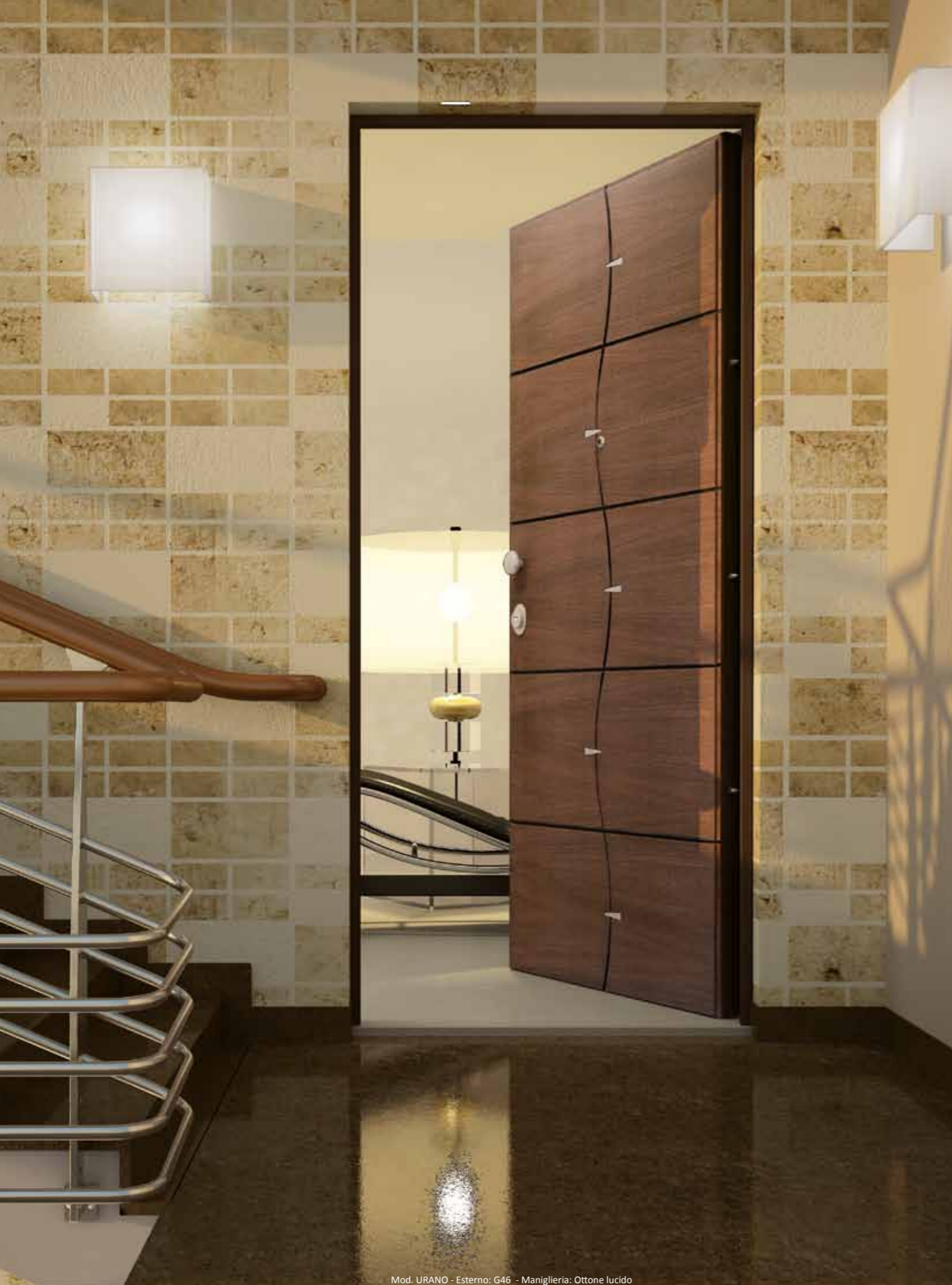
Mod. URANO - Esterno: G46 - Maniglia: Ottone lucido URANO - External: G46 - Polished Brass Handle