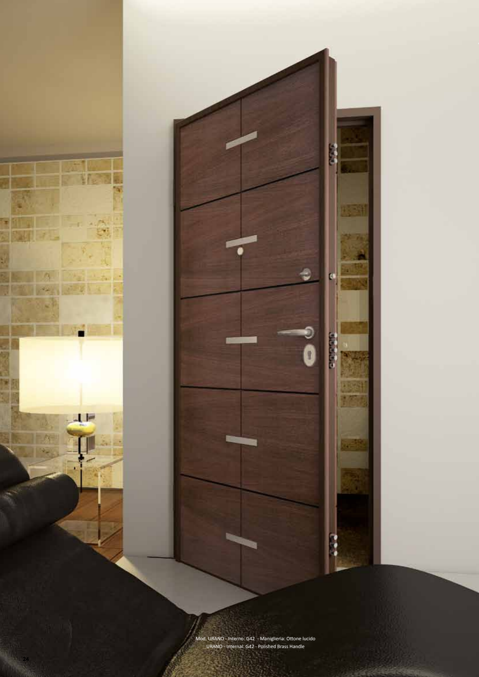
Mod. URANO - Interno: G42 - Maniglia: Ottone lucido URANO - Internal: G42 - Polished Brass Handle