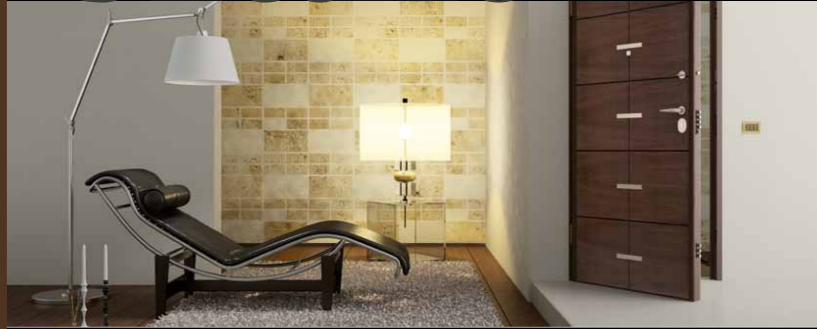
Porta blindata - Resistenza all'effrazione "Classe 3"